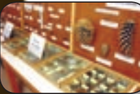
une xylothèque pour l'étude des essences truffières caractéristiques

> 5 jours de formation intensive animés par des experts en trufficulture pour répondre à vos attentes et mettre en perspective vos envies de bonnes pratiques sylvicoles à travers la conduite de truffières.